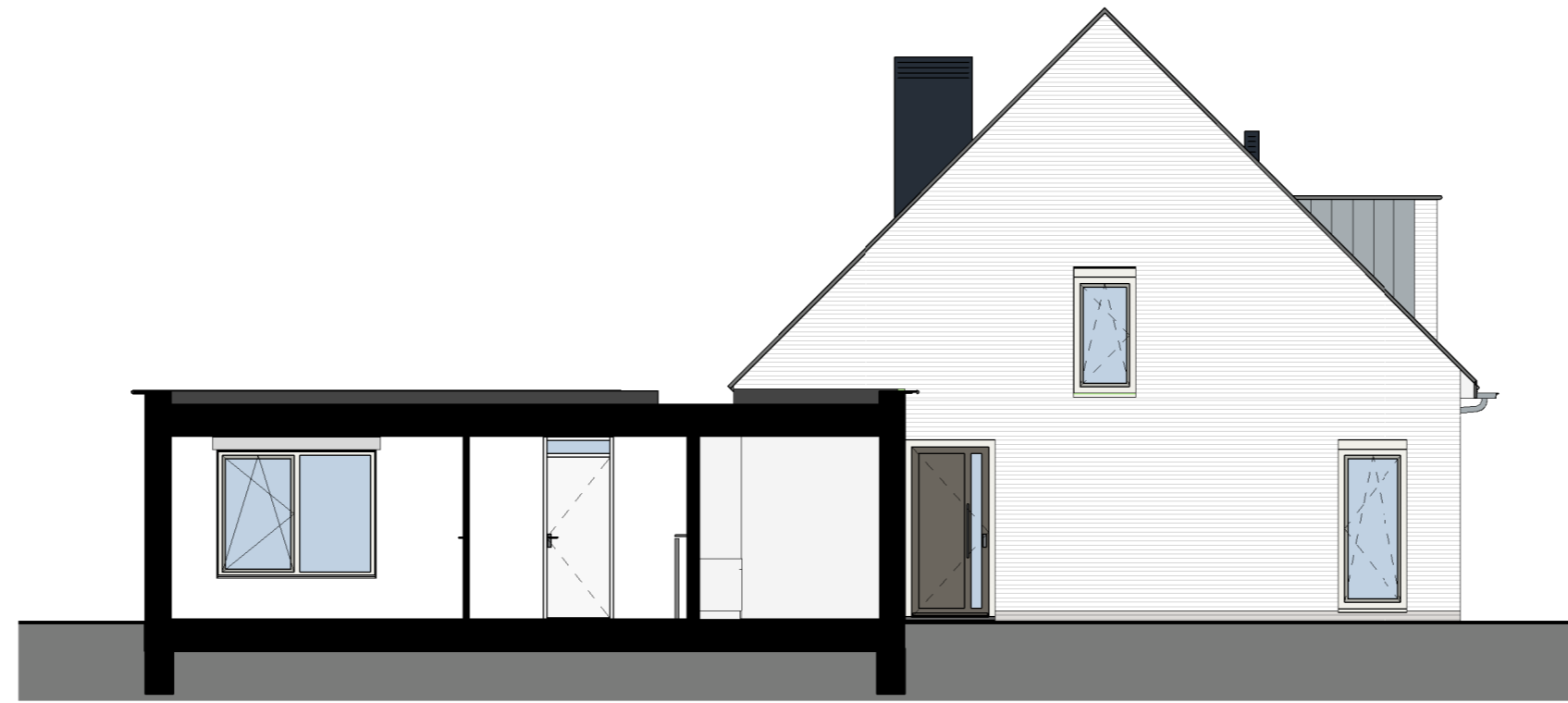
zijgevel entree/ doorsnede B-B